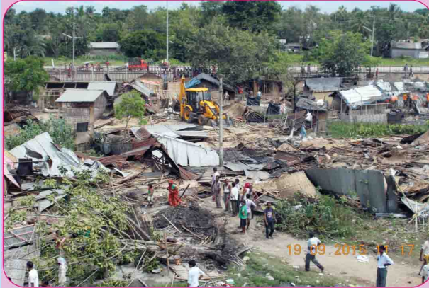
लंका स्टेशन में अनाधिकृत अतिक्रमण हटाए जाने का दृश्य।

मंडल में अनाधिकृत अतिक्रमण को हटाना एक बड़ी चुनौती है। इस अवधि में करीमगंज, लामडिंग, सिलचर और लंका में अति संवेदनशील और अत्यधिक जटिल स्थानों पर लगभग 44067 वर्ग मीटर क्षेत्र के 871 हार्ड किस्म के अतिक्रमण को हटाया गया। इस प्रकार संवर्धनी प्रगति 977 और क्षेत्रफल लगभग 71827 वर्ग मीटर प्राप्त की गई।