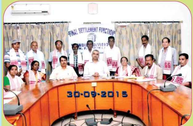
मंडल मुख्यालय के सभाकक्ष में आयोजित अंतिम निपटारा बैठक का दृश्य।

इस अवधि में अधिवर्षिता के आधार पर 77 तथा स्वेच्छिक सेवानिवृत्ति के 03 मामलों का निपटारा किया गया।