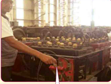
नार्डफ स्विच के साथ जुड़े हुए ट्राली पर रखी गई बैटरियों का दृश्य।

पूर्व में इंजनों के ट्रकों को मैनुअल रूप से हटाया जाता था जिसमें बहुत श्रम-शक्ति और समय की आवश्यकता होती थी। ट्रक रन आउट मोबाइल ट्राली के इस नई खोज से पिछली व्यवस्था में जहाँ छह लोगों की आवश्यक होती थी, वहाँ केवल एक आदमी के द्वारा कार्य संचालित किया जा सकता है। परिणाम-स्वरूप मानव शक्ति की बचत के अलावा जोखिम कारकों का पर्याप्त उन्मूलन भी हुआ है। इंजनों में इस्तेमाल बैटरी एक ट्राली पर रखी जाती हैं। सभी बैटरी एक नार्डफ स्विच के साथ जुड़े हुए होते हैं। यह लोको ट्रक ट्राली के किसी एक कर्षण मोटर्स के साथ जोड़कर अंडर ट्रक को बाहर निकालने के लिए प्रयोग किया जाता है।