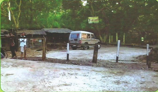
धरमतुल-डेकरागुड़ी स्टेशन के बीच कि.मी. 93/1-2 पर अवस्थित समपार फाटक सं. एसटी-31 को बंद किए जाने का दृश्य

रेल दुर्घटना के मामले में समपार फाटक अत्यंत संवेदनशील माने जाते हैं। अवधि के दौरान सेनचोवा-सिलघाट सेक्शन में सीएस-1, सीएस-21, सीएस-22, सीएस-31, सीएस-33, सीएस-38, सीएस-39, सीएस-43, सीएस-52, सीएस-58, सीएस-66, नारंगी-लामडिंग सेक्शन में एसटी-31 एवं एसटी-46, सेनचोवा-मैराबाड़ी सेक्शन में एसएम-47 तथा बराईग्राम-अगरतला सेक्शन में बीएस-33 समपार फाटकों को बंद किया गया। इस प्रकार वर्ष 2012-13 के लिए निर्धारित कुल 15 समपार फाटकों को बंद किए जाने के लक्ष्य को मार्च 2013 तक शत प्रतिशत हासिल कर लिया गया।