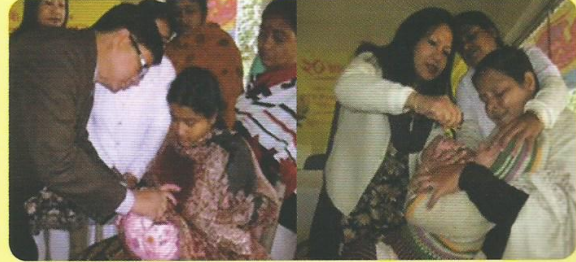
मुख्य चिकित्सा अधीक्षक तथा अपर मुख्य चिकित्सा अधीक्षक/प्रशासन बच्चों को पोलियो की खुराक पिलाते हुए।

मंडल में पाँच साल से कम उम्र के बच्चों को पोलियो से मुक्त रखने के उद्देश्य से पूरे मंडल में रेल कालोनियों, स्टेशनों, पैसेंजर/मेल/एक्सप्रेस आदि गाड़ियों में 20 जनवरी से 22 जनवरी 2013 तथा 24 फरवरी से 26 फरवरी तक दो चरणों में विशेष कार्यक्रम के अधीन कुल 17059 बच्चों को पोलियो की खुराक पिलाई गई।