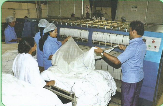
मैकेनाइज्ड लॉन्ड्री, कामाख्या में मशीनों पर कार्यरत लॉन्ड्री के कर्मचारियों का दृश्य।