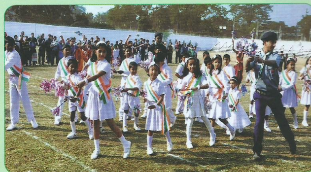
गणतंत्र दिवस समारोह के अवसर पर भारत स्काउट एवं गाइड द्वारा प्रस्तुत रंगा-रंग सांस्कृतिक कार्यक्रम का दृश्य।

केन्द्रीय विद्यालय, मंडल रेल महिला कल्याण संगठन द्वारा संचालित रवीन्द्र नर्सरी स्कूल एवं ज्ञानदीप में भी गणतंत्र दिवस ध्वजारोहण समारोह आयोजित किए गए। इस अवसर पर मंडल रेल महिला कल्याण संगठन, लामडिंग अपनी गतिविधियों में वृद्धि करते हुए रेलवे के महिलाओं एवं बच्चों को कंप्यूटर प्रशिक्षण प्रदान करने के उद्देश्य से कंप्यूटर प्रशिक्षण केन्द्र का शुभारंभ किया।