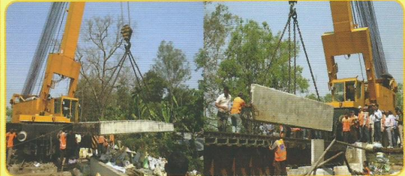
लामडिंग-फरकार्टिंग सेक्शन में ब्रिज सं.215 के स्टील गर्डरों को पीएससी स्लैब से बदलने का दृश्य।

लामडिंग-फरकार्टिंग सेक्शन में 6.10 मीटर लम्बे ब्रिज सं. 215 में 2x6.10 मीटर, 1x12.20 मीटर स्पान के दो स्टील गर्डरों को पीएससी स्लैब से बदलवाया गया। इस प्रकार एक ब्रिज के दो गर्डरों को बदलने के वार्षिक लक्ष्य को पूरा कर लिया गया।