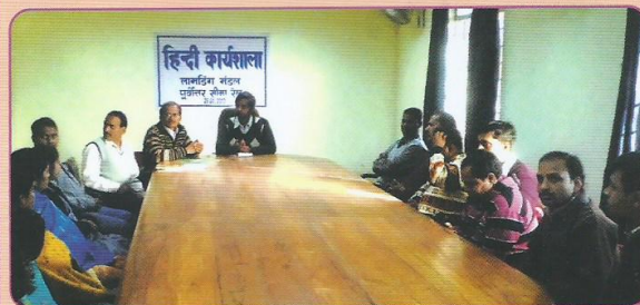
वरिष्ठ मंडल यंत्रिक इंजीनियर/डीजल/लामडिंग के कार्यालय में आयोजित हिंदी कार्यशाला का दृश्य

हिंदी में कार्यसाधक ज्ञान प्राप्त कर्मचारियों को हिंदी में काम करने की झिझक को दूर करने के लिए मंडल मुख्यालय तथा बाहर स्थित कार्यालयों/स्टेशनों में प्रति वर्ष हिंदी कार्यशालाओं का आयोजन किया जाता है। जनवरी-मार्च 2013 के दौरान कुल 3 हिंदी कार्यशालाओं का आयोजन कर 68 कर्मचारियों को दैनिक सरकारी कामकाज के विविध विषयों में हिंदी के प्रयोग से संबंधित व्यावहारिक ज्ञान दिलवाया गया।