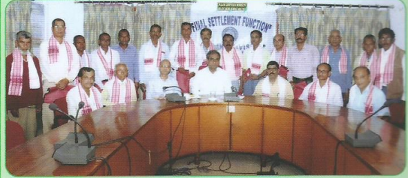
सेवानिवृत्ति के लिए आयोजित निपटारा बैठक का दृश्य

मंडल में जनवरी-मार्च 2013 की अवधि में समूह 'ग' में अनुकंपा के आधार पर 7 उम्मीदवारों को रेल सेवा में नियुक्ति प्रदान की गई। इस अवधि में अधिवर्षिता के आधार पर 122 तथा स्वैच्छिक सेवानिवृत्ति के कुल 5 मामलों का निपटारा किया गया।