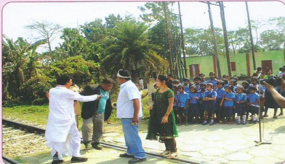
मानवरहित समपार फाटक पर आयोजित नुककड़ नाटक का दृश्य।

मंडल में संरक्षा जागरूकता अभियान के तहत सड़क प्रयोक्ताओं के साथ-साथ क्षेत्र की जनता तथा स्कूली बच्चों को रेलवे समपार फाटकों विशेषकर मानव रहित समपार फाटकों पर सावधानी बरतने के लिए विविध जानकारीयों प्रदान की गई। इस दौरान मंडल के समपार फाटकों पर संरक्षा से संबंधित विविध पैम्फलेट वितरित करवाए गए। मानवरहित समपार फाटकों पर नुककड़ नाटकों का आयोजन किया गया तथा स्टेशनों, क्यू-लॉबी एवं रनिंग रूमों में संरक्षा संगोष्ठियों का आयोजन कर रेल कर्मियों को भी संरक्षा के प्रति जागरूक किया गया।