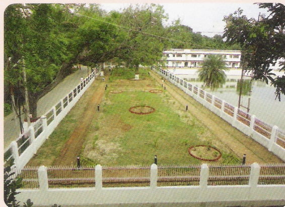
'लोको पुकुर पार्क' का एक दृश्य

रेल कालोनियों, कार्यालय तथा स्टेशन परिसरों को प्रदूषण मुक्त कर पर्यावरण हितैषी वातावरण का निर्माण करने के उद्देश्य से रेलवे की खाली पड़ी हुई भूमि पर जगह-जगह बागवानी कर सजाया गया। मंडल के लोको कॉलोनी में 'लोको पुकुर पार्क' का निर्माण कालोनियों में पर्यावरण संरक्षण का एक उदाहरण है।