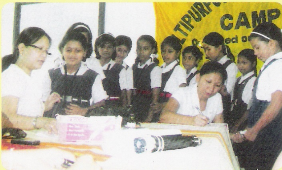
रेलवे उच्चतर विद्यालय, लामडिंग में आयोजित स्वास्थ्य जॉच का एक दृश्य

मंडल रेल अस्पताल, लामडिंग के तत्वावधान में 12 जुलाई 2011 को मन्दरडिसा में, 7 सितम्बर 2011 को लामडिंग में तथा 23 सितम्बर 2011 को डिमापुर में बहुउद्देश्यीय स्वास्थ्य जॉच शिविर का आयोजन कर रेल कर्मिकों के स्वास्थ्य की गहन जॉच की गई। इस दौरान लामडिंग मंडल के रेलवे स्कूलों के साथ-साथ छोटे-छोटे स्टेशनों पर भी कुल 16 बहुउद्देश्यीय स्वास्थ्य जॉच एवं स्वास्थ्य जागरूकता अभियान चलाया गया।