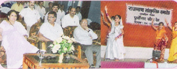
सांस्कृतिक संध्या के रंगा-रंग कार्यक्रम का एक दृश्य

मंडल मुख्यालय सहित मंडल के प्रमुख कार्यालयों/स्टेशनों में आयोजित किए गए हिंदी टिप्पण एवं प्रारूप लेखन, हिंदी वाक् प्रतियोगिता तथा राजभाषा प्रश्नोत्तरी प्रतियोगिता में प्रथम तीन स्थान प्राप्त करने वाले कुल 45 कर्मचारियों को नकद पुरस्कार तथा योग्यता प्रमाण-पत्र प्रदान कर सम्मानित किया गया।