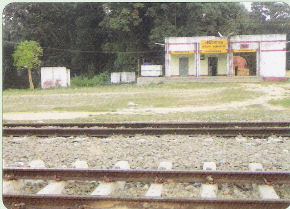
त्रिपुरा राज्य के धर्मनगर-अगरतला मीटर लाइन सेक्शन का क्रॉसिंग स्टेशन 'पानीसागर'

बदरपुर-अगरतला मीटर लाइन सेक्शन में गाड़ियों की आवागमन में सुधार लाने के उद्देश्य से जुलाई 2011 माह में धर्मनगर-पेंचरथाल स्टेशनों के मध्य अवस्थित पानीसागर स्टेशन को 'बी' श्रेणी के क्रॉसिंग स्टेशन के लिए प्रारंभ किया गया।