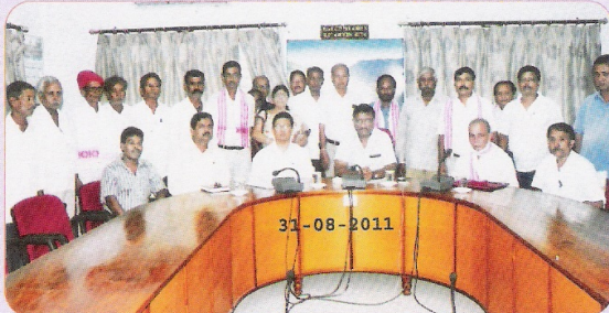
अधिवर्षिता पर सेवानिवृत्त कर्मचारियों के लिए आयोजित कार्यक्रम का दृश्य

जुलाई-सितम्बर 2011 की अवधि में अधिवर्षिता पर सेवानिवृत्ति के कुल 90 तथा स्वेच्छिक सेवानिवृत्ति के कुल 5 मामलों का निपटारा किया गया।