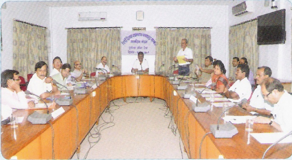
अधिकारियों के लिए राजभाषा प्रश्नोत्तरी प्रतियोगिता के आयोजन का दृश्य

14 सितम्बर 2011 को मंडल रेल प्रबंधक द्वारा दीप प्रज्वलित कर मंडल मुख्यालय में हिंदी दिवस का पालन किया गया। मंडल रेल प्रबंधक महोदय ने महाप्रबंधक के हिंदी दिवस संदेश के माध्यम से कार्यालयों में राजभाषा के कामकाज में और अधिक वृद्धि लाने का संदेश दिया। इस अवसर पर स्थानीय सभा कक्ष में अधिकारियों के लिए राजभाषा प्रश्नोत्तरी प्रतियोगिता का आयोजन किया गया। मंडल में 15 सितम्बर से 30 सितम्बर 2011 तक राजभाषा पखवाड़ा का पालन किया गया। इस दौरान मंडल मुख्यालय लामडिंग में कर्मचारियों के लिए दो हिंदी टिप्पण आलेखन कार्यशालाओं का आयोजन किया गया जिसमें 36 कर्मचारियों ने हिस्सा लिया। इसके अलावा मंडल के प्रमुख कार्यालयों एवं स्टेशनों में विभिन्न कार्यक्रम भी आयोजित किए गए।