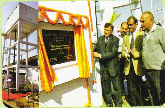
सरूपथार रेलवे स्टेशन पर शुद्ध पेय जल की आपूर्ति हेतु निर्मित नए जलापूर्ति व्यवस्था के उद्घाटन का एक दृश्य।

निरीक्षण के दौरान महाप्रबंधक महोदय ने सरूपथार स्टेशन पर रेल कालोनियों में शुद्ध पेय जल की आपूर्ति हेतु निर्मित नए जलापूर्ति व्यवस्था का उद्घाटन किया।