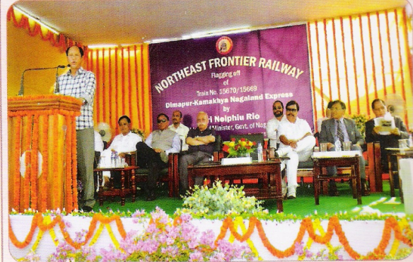
डिमापुर-कामाख्या नागालैण्ड एक्सप्रेस के उद्घाटन समारोह को संबोधित करते हुए माननीय मुख्यमंत्री, नागालैण्ड श्री नैफ्यू रिओ।