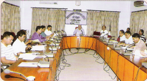
मंडल राजभाषा कार्यान्वयन समिति की बैठक को संबोधित करते हुए अपर मंडल रेल प्रबंधक तथा मंडल के पदाधिकारीगण।

मंडल में 17 अक्टूबर 2011 को मंडल राजभाषा कार्यान्वयन समिति, लामडिंग की तिमाही बैठक का आयोजन किया गया। बैठक में रेलवे बोर्ड द्वारा निर्धारित विविध मदों पर विस्तार से विचार-विमर्श किया गया। मंडल में हिंदी का प्रयोग बढ़ाने तथा दैनिक कामकाज में राजभाषा का अधिकाधिक प्रयोग करने के संबंध में सदस्यों ने अपने-अपने सुझाव दिए।