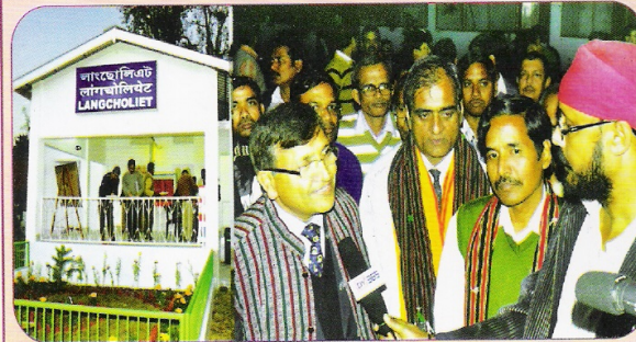
लांगचोलियेट स्टेशन पर स्थानीय जन समुदाय द्वारा महाप्रबंधक, मंडल रेल प्रबंधक एवं अन्य पदाधिकारियों के स्वागत का दृश्य

इस सेक्शन के लांगचोलियेट स्टेशन के नए स्टेशन भवन का उद्घाटन महाप्रबंधक महोदय के कर कमलों से संपन्न हुआ। कार्बी आंगलांग जिले के इस स्टेशन के निरीक्षण के दौरान स्थानीय जन समुदाय ने अपने पारंपरिक रीति के अनुसार महाप्रबंधक, मंडल रेल प्रबंधक एवं अन्य पदाधिकारियों का स्वागत किया तथा अपनी समसयाओं से उन्हें अवगत कराया।