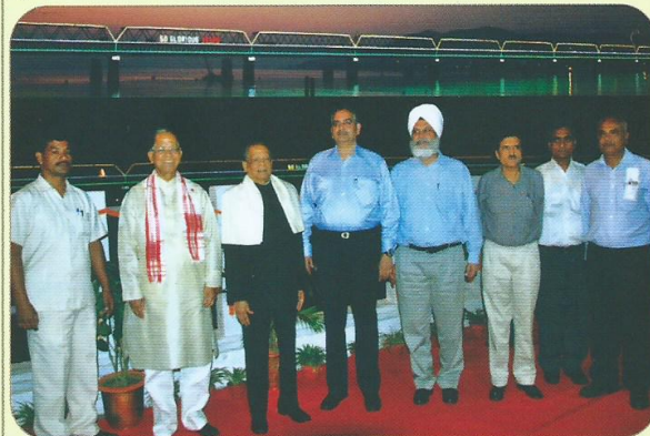
सराईघाट ब्रिज के 50वां गौरवपूर्ण वर्ष के स्वर्ण जयंती समारोह के आयोजन का दृश्य।

असम के लोगों द्वारा अथक संघर्ष के बाद ब्रह्मपुत्र नदी पर 1962 में बना सराईघाट पुल न केवल इस क्षेत्र को संपूर्ण देश से जोड़ता है वल्कि यह पूर्वोत्तर के सात महत्वपूर्ण राज्यों के बीच एक कड़ी का कार्य करता है। सराईघाट पुल रेल सह सड़क यातायात की सेवा प्रदान करते हुए अपना 50वां गौरवपूर्ण वर्ष पूरा किया है। माननीय राज्यपाल, माननीय मुख्यमंत्री, असम, सदस्य इंजीनियरी, रेलवे बोर्ड तथा महाप्रबंधक, पूर्वोत्तर सीमा रेल की उपस्थिति में 06 नवम्बर 2012 को सराईघाट पुल के स्वर्ण जयंती समारोह का सफलता पूर्वक आयोजन किया गया।