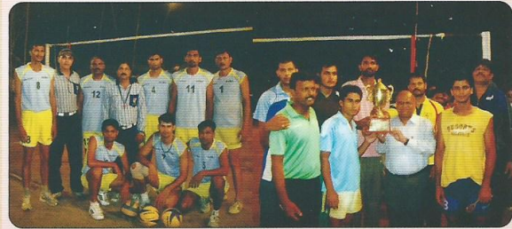
लामडिंग मंडल में आयोजित अंतर मंडल वालीबॉल चम्पियनशिप प्रतियोगिता का दृश्य

लामडिंग मंडल मुख्यालय के विवेकानन्द रेल स्टेडियम में 16 से 18 अक्टूबर 2012 तक अंतर मंडल वालीबॉल चम्पियनशिप प्रतियोगिता का आयोजन किया गया। पूर्वोत्तर सीमा रेल मुख्यालय, मालीगॉव सहित सभी पाँच मंडलों तथा डिब्रूगढ़ एवं न्यू बंगाईगॉव रेल कारखानों की टीमों ने प्रतियोगिता में सहभागिता किया। बेहतर प्रदर्शन करते हुए लामडिंग मंडल की टीम ने वालीबॉल चम्पियनशिप ट्राफी अपने नाम किया। प्रतियोगिता में मुख्यालय मालीगॉव की टीम रनर्स-अप रही।