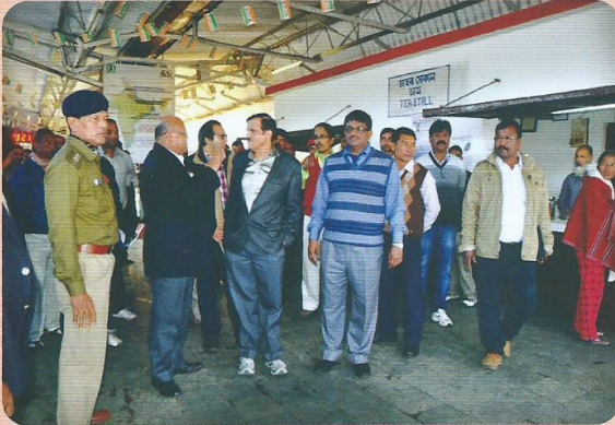
अपर महाप्रबंधक द्वारा लामडिंग-लोवर हाफलंग मीटर लाइन सेक्शन के निरीक्षण का दृश्य