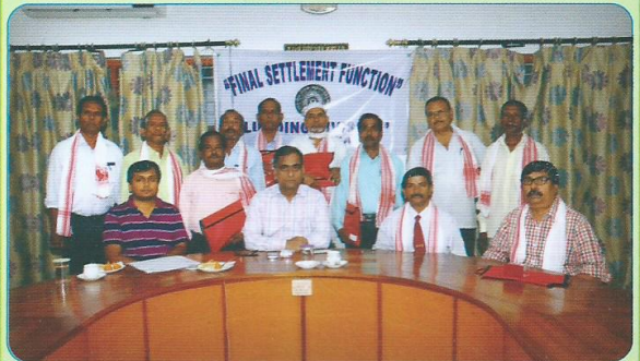
सेवानिवृत्ति के लिए आयोजित निपटारा बैठक का दृश्य

इस अवधि में अधिवर्षिता के आधार पर 97 तथा स्वैच्छिक सेवानिवृत्ति के कुल 03 मामलों का निपटारा किया गया।