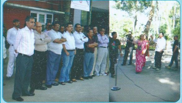
मंडल कार्यालय परिसर में आयोजित नुक्कड़ नाटक का एक दृश्य

मंडल में 29 अक्टूबर 2012 से 02 नवम्बर 2012 तक सतर्कता जागरूकता सप्ताह का पालन किया गया। इस अवसर पर 29 अक्टूबर को मंडल कार्यालय परिसर में एक शपथ ग्रहण समारोह का आयोजन किया गया। मंडल के प्रमुख स्थलों के साथ-साथ सभी स्टेशनों में पोस्टर एवं बैनर लगाए गए। सतर्कता संगठन द्वारा 31 अक्टूबर 2012 को मंडल कार्यालय परिसर में सतर्कता जागरूकता पर एक नुक्कड़ नाटक तथा 02 नवम्बर को 'सतर्कता जागरूकता' विषय पर एक सेमिनार का आयोजन किया गया।