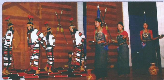
लामडिंग दयांग अधिकारी क्लब में आयोजित सांस्कृतिक कार्यक्रम की मनोरम झाकियां।

महाप्रबंधक के वार्षिक निरीक्षण के संंध्या पर लामडिंग स्थित दयांग अधिकारी क्लब में लामडिंग, डिफू एवं अगरतला की टीम ने एक रंगा-रंग सांस्कृतिक कार्यक्रम प्रस्तुत किया।