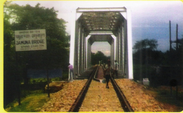
जमुनामुख और जुगीजान के मध्य कि.मी. 131/2 -131/3 पर पुनर्निर्मित ब्रिज सं. 124 का दृश्य।

जमुनामुख और जुगीजान के मध्य कि.मी. 131/2 -131/3 पर ब्रिज सं. 124 का पुनर्निर्माण तथा शुभारंभ किया गया जिससे सेक्शन में 100 कि.मी. के गति को बरकरार रखने में कामयाबी हासिल हो सकी। साथ ही 2 मिनट के समय की बचत भी होती है।