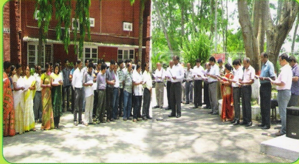
आतंकवाद विरोधी दिवस के अवसर पर शपथ ग्रहण का दृश्य।

मंडल में 21 मई 2013 को आतंकवाद विरोधी दिवस का पालन किया गया। इस अवसर पर मंडल मुख्यालय के सभी अधिकारियों एवं कर्मचारियों ने कार्यालय भवन के सम्मुख 11.00 बजे हिंसा और आतंकवाद से दूर रहने का शपथ लिया।