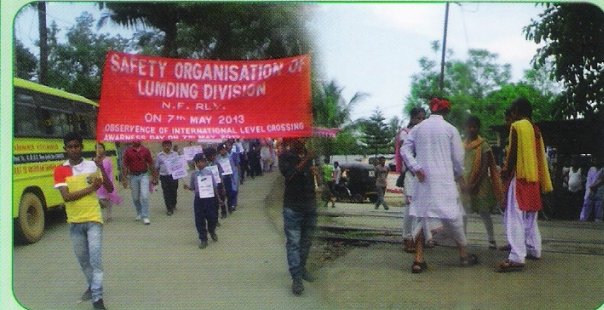
अंतर्राष्ट्रीय समपार फाटक जागरुकता दिवस के पालन का दृश्य।

समपार फाटकों पर संरक्षापूर्वक काम करने के उद्देश्य से 7 मई 2013 को अंतर्राष्ट्रीय समपार फाटक जागरुकता दिवस का पालन किया गया। एक सप्ताह के कार्यक्रम में मंडल में समपार फाटकों पर होने वाली दुर्घटनाओं तथा इन पर बरती जाने वाली सावधानी के संबंध में रेल कर्मचारियों, यात्रियों और क्षेत्र की जनता को जागरुक किया गया।