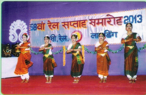
58वें रेल सप्ताह समारोह के सांस्कृतिक कार्यक्रम का एक दृश्य।

सांस्कृतिक कार्यक्रम के दौरान मंगलगान, सामूहिक नृत्य, कौवाली, गजल तथा भजन आदि प्रस्तुत किए गए। समारोह के दौरान प्रस्तुत उक्त सभी कार्यक्रम दर्शकों के लिए आकर्षक, मनभावन, प्रेरणादायक एवं मनोरंजन प्रधान थे।