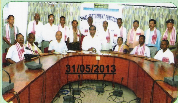
मंडल मुख्यालय में आयोजित सेवानिवृत्ति की निपटारा बैठक का दृश्य।

मंडल में अप्रैल-जून 2013 की अवधि में समूह 'घ' में अनुकंपा के आधार पर 61 उम्मीदवारों को रेल सेवा में नियुक्ति प्रदान की गई। इस अवधि में अधिवर्षिता के आधार पर 79 तथा स्वैच्छिक सेवानिवृत्ति के एकमात्र मामला का निपटान किया गया। इसके अलावा स्काउट एवं गाइड कोटा में 2 उम्मीदवार, खेलकूद कोटा में 11 उम्मीदवार तथा लार्गस (LARGESS) योजना के तहत 25 उम्मीदवारों को रेल सेवा में नियुक्ति प्रदान की गई।