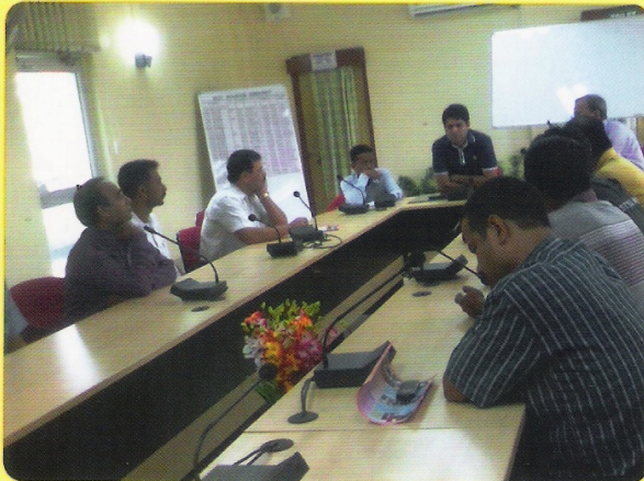
9 मई 2013 को न्यू गुवाहाटी/डीजल शेड में आयोजित हिंदी कार्यशाला के आयोजन का दृश्य।

हिंदी में कार्यसाधक ज्ञान प्राप्त कर्मचारियों को हिंदी में काम करने की झिझक को दूर करने के लिए मंडल मुख्यालय तथा बाहर स्थित कार्यालयों/स्टेशनों में प्रति वर्ष हिंदी कार्यशालाओं का आयोजन किया जाता है। इस अवधि में कुल 3 हिंदी कार्यशालाओं का आयोजन कर 68 कर्मचारियों को दैनिक सरकारी कामकाज के विविध विषयों में हिंदी के प्रयोग से संबंधित व्यावहारिक ज्ञान दिलवाया गया।