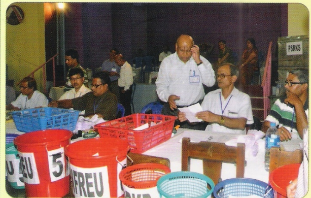
सेक्रेट बैलट की गिनती का दृश्य।