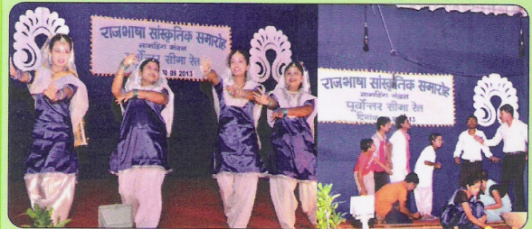
नृत्य तथा एकांकी नाटक प्रस्तुत करते हुए कलाकार।