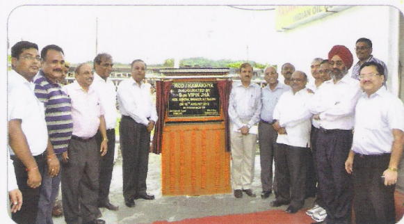
अपर महाप्रबंधक/पू.सी.रेल द्वारा कामाख्या में नए आरसीडी डिपो के उद्घाटन का एक दृश्य।

अपर महाप्रबंधक/पू.सी.रेल ने 16 अगस्त को कामाख्या में नए आरसीडी डिपो का उद्घाटन किया। इससे कामाख्या से खुलने वाली गाड़ियों में फ्यूलिंग कामाख्या स्टेशन पर ही सम्भव हो जाएगा। इससे कामाख्या से खुलने वाली गाड़ियों में फ्यूलिंग की वजह से होने वाली विलम्ब को रोका जा सकेगा। पहले फ्यूलिंग के लिए रेल को गुवाहाटी ले जाना पड़ता था। जिससे न केवल गाड़ियों का डिस्टेंशन होता था बल्कि इसके लिए अतिरिक्त पथ की भी आवश्यकता पड़ती थी।