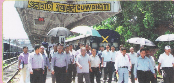
29 एवं 30 जुलाई 2013 को अंतर रेल संरक्षा आडिट टीम द्वारा गुवाहाटी स्टेशन के निरीक्षण का दृश्य।

29 एवं 30 जुलाई 2013 को पूर्व मध्य रेल के मुख्य संरक्षा अधिकारी, मुख्य सिगनल एवं दूरसंचार इंजीनियर/योजना, सीईडीई, मुख्य चल स्टॉक इंजीनियर एवं उप मुख्य इंजीनियर/रेलपथ की एक टीम ने लामडिंग मंडल के गुवाहाटी क्षेत्र का निरीक्षण किया। संरक्षा आडिट टीम ने गुवाहाटी स्टेशन, गुवाहाटी यार्ड, गुवाहाटी पूर्व केबिन, सिगनलिंग रूम, एसपी एआरएमवी, क्रू-लॉबी, न्यू गुवाहाटी तथा गुवाहाटी के रनिंग रूम, न्यू गुवाहाटी में एआरटी तथा समपार फाटक (यातायात) एसटी-27 का निरीक्षण किया। संरक्षा आडिट टीम ने मंडल के निष्पादन एवं रख-रखाव की प्रशंसा की।