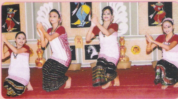
अंतर मंडल संगीत एवं नृत्य प्रतियोगिता के कार्यक्रम में प्रस्तुत समूह नृत्य का एक दृश्य।

रेलवे इंस्टीट्यूट/लामर्डिंग में 19 एवं 20 सितम्बर 2013 को अंतर मंडल संगीत, नृत्य एवं नाटक प्रतियोगिता का आयोजन किया गया। इन प्रतियोगिताओं में कुल 53 कलाकारों ने हिस्सा लिया।