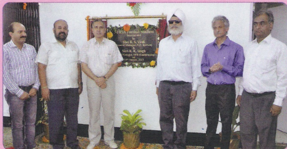
लोको कालोनी, पाण्डू में नवनिर्मित फुटबॉल स्टेडियम के उद्घाटन का दृश्य। इस अवसर पर पू.सी.रेल एवं ग्रीन वैली स्पोर्ट्स क्लब के बीच एक फ़ैन्डली फुटबॉल मैच का आयोजन किया गया।

महाप्रबंधक/पू.सी.रेल तथा महाप्रबंधक/निर्माण/मालीगॉव ने 14 अगस्त 2013 को लोको कालोनी, पाण्डू में नवनिर्मित फुटबॉल स्टेडियम का उद्घाटन किया।