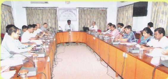
मंडल मुख्यालय में 16 सितम्बर 2013 को अधिकारियों के लिए आयोजित राजभाषा प्रश्नोत्तरी प्रतियोगिता का दृश्य।

मंडल मुख्यालय में 16 सितम्बर 2013 को स्थानीय सभाकक्ष में अधिकारियों के लिए राजभाषा प्रश्नोत्तरी प्रतियोगिता का आयोजन किया गया। प्रतियोगिता में प्रथम दो स्थान प्राप्त करने वाले समूह को प्रोत्साहन पुरस्कार प्रदान कर सम्मानित किया गया तथा अन्य सभी प्रतिभागियों को सातवना पुरस्कार प्रदान किया गया।