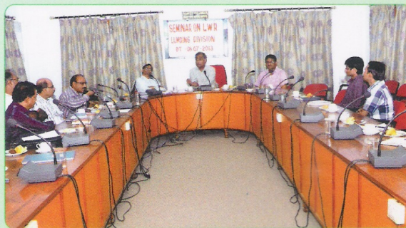
मंडल के सभाकक्ष में एल डब्ल्यू आर पर आयोजित सेमिनार में उपस्थित इंजीनियरी विभाग के पदाधिकारीगण।

मुख्य सामान्य इंजीनियर/मालीगॉव की उपस्थिति में 8 जुलाई, 2013 को मंडल के सभाकक्ष में एल डब्ल्यू आर पर एक सेमिनार का आयोजन किया गया। इस सेमिनार में मंडल के इंजीनियरी विभाग के सभी अधिकारियों ने सहभागिता किया।