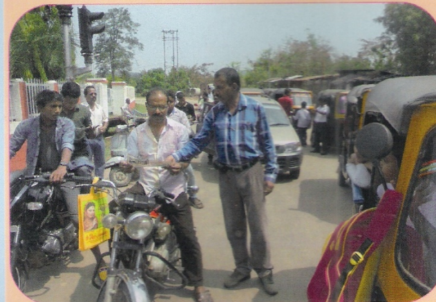
समपार फाटक पर पम्पलेट के माध्यम से सड़क उपयोक्ताओं को समपार पर संरक्षा की जानकारी देते हुए संरक्षा विभाग/लामडिंग का एक कर्मचारी।

मानवरहित समपारों पर संरक्षा जागरूकता के लिए स्थानीय जनता के बीच पम्पलेट वितरित किए गए, हल्के वाहनों पर पर्चे चिपकाए गए, एसएमएस भेजे गए तथा नुक्कड़ नाटक का मंचन किया गया।