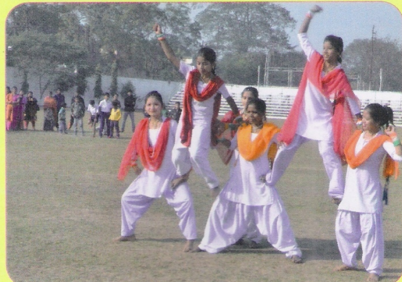
गणतंत्र दिवस के अवसर पर रेलवे उच्चतर माध्यमिक विद्यालय के बच्चों द्वारा प्रस्तुत रंगा-रंग सांस्कृतिक कार्यक्रम का दृश्य।

समारोह में भारत स्काउट एवं गाइड, लामर्डिंग तथा रेलवे उच्चतर माध्यमिक विद्यालय, लामर्डिंग के बच्चों द्वारा रंगा-रंग सांस्कृतिक कार्यक्रम प्रस्तुत किया गया। रेल सुरक्षा बल, रेल सुरक्षा विशेष बल, राष्ट्रीय कैडेट कोर तथा भारत स्काउट एवं गाइड के मार्चफास्ट परेड समारोह का विशेष आकर्षण रहा।