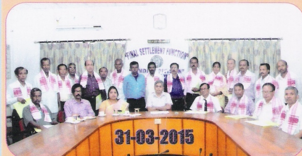
दिनांक 31.03.2015 को मंडल रेल प्रबंधक कार्यालय के सभाकक्ष में सेवा-निवृत्ति के लिए आयोजित निपटारा बैठक का दृश्य।

अवधि के दौरान LARGEES के तहत कुल 46 कर्मचारियों के आश्रितों को रेल सेवा में नियुक्ति प्रदान की गई।