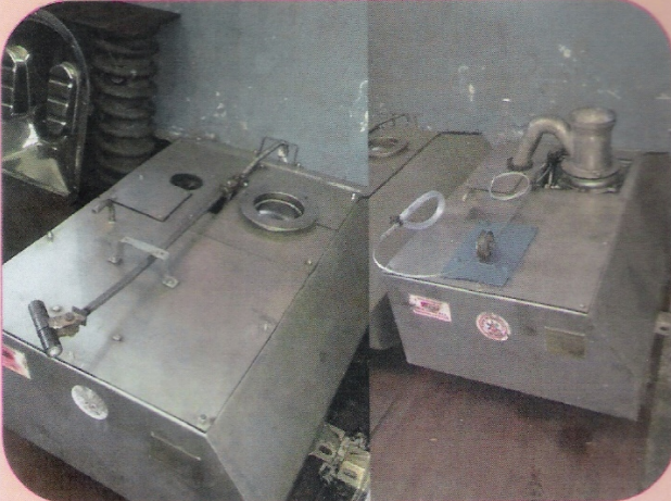
जैव शौचालय में लगाए गए ऑटो रिटर्न तंत्र सहित सरल लीवर का दृश्य।

जैव शौचालय में बाल वॉल्व को आसानी से संचालित करने के लिए ऑटो रिटर्न तंत्र के साथ एक सरल लीवर विकसित किया गया है। लीवर को खींचने पर (बायो टैंक के ऊपर लगे) वॉल्व खुल जाते हैं और लीवर को मुक्त करते ही स्प्रिंग एक्शन के कारण स्वतः बंद हो जाते हैं। इस मॉडल का लाभ यह है कि केवल लीवर खींचकर पिट लाइन, सीक लाइन और यहाँ तक कि स्टेशन पर प्लेटफार्म क्षेत्र में भी इसे बहुत आसानी से संचालित किया जा सकता है।