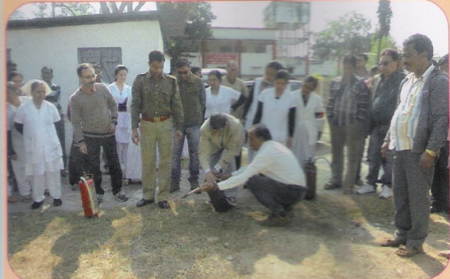
संरक्षा विभाग द्वारा रेलवे अस्पताल, लामडिंग में अधिकारियों/कर्मचारियों को अग्निशामक के प्रयोग के बारे में व्यावहारिक प्रशिक्षण दिए जाने का दृश्य।

संरक्षा हमारी प्राथमिकता है। मंडल ने रेल कर्मचारियों तथा स्थानीय जनता को रेलवे संरक्षा के प्रति जागरूक करने के लिए संरक्षा ड्राइव के साथ-साथ विविध कार्यक्रम किए जाते हैं। अवधि के दौरान मंडल रेल चिकित्सालय, लामडिंग, डीजल शेड/लामडिंग आदि स्थलों में संरक्षा विभाग द्वारा अधिकारियों/कर्मचारियों को अग्निशामक के प्रयोग के बारे में विस्तृत जानकारी दी गई और व्यावहारिक प्रशिक्षण भी दिया गया।