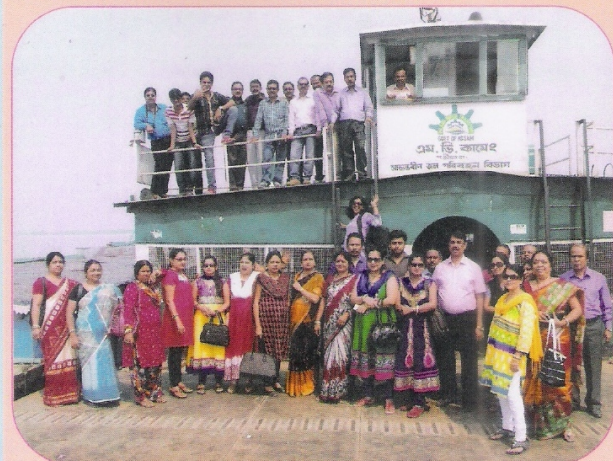
‘माजुली’ में ताजी हवा शिविर के एक यादगार पल का दृश्य।

दिनांक 21.03.2015 एवं 22.03.2015 को लामडिंग मंडल द्वारा कर्मचारियों के स्वास्थ्य लाभ के लिए माजुली में कर्मचारियों की ताजी हवा शिविर, 2015 का आयोजन किया गया। शिविर में मंडल के रेल अधिकारी/कर्मचारी तथा उनके परिजनों ने भाग लिया।