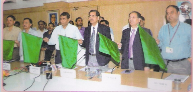
माननीय केन्द्रीय रेल मंत्री, श्री सुरेश प्रभाकर प्रभु द्वारा नई दिल्ली से रिमोट के माध्यम से लामडिंग से सालचापरा के लिए बड़ी लाइन की पहली मालगाड़ी को हरी झंडी दिखाने का दृश्य।

लामडिंग-सिलचर सेक्शन के आमाम परिवर्तन के लिए 1 अक्टूबर, 2014 से 31 मार्च 2015 तक 6 महीनों के लिए मेगा ब्लॉक लिया गया था। लेकिन रेलवे अधिकारियों एवं कर्मचारियों की तत्परता से निर्धारित समय से पहले ही सेक्शन मालगाड़ी आवागमन के लिए तैयार हो गया और दिनांक 27.03.2015 को माननीय केन्द्रीय रेलमंत्री द्वारा नई दिल्ली से रिमोट के माध्यम से लामडिंग से सालचापरा के लिए बड़ी लाइन की पहली मालगाड़ी को हरी झंडी दिखाकर खाना किया।